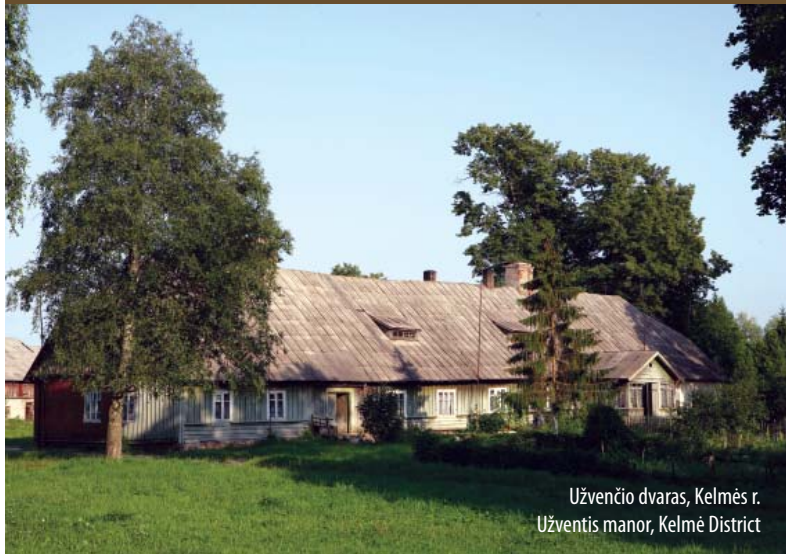
Užvenčio dvaras, Kelmės r. Užventis manor, Kelmė District