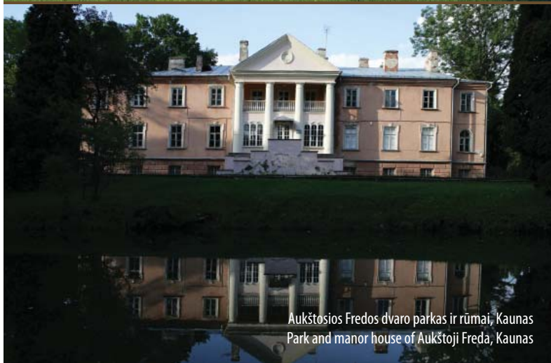
Aukštojos Fredos dvaro parkas ir rūmai, Kaunas Park and manor house of Aukštoji Freda, Kaunas

eral notable parks — Veisiejai Park situated in the lakes area next to a majestic church, and the park of the Aštriosios Kirsnos Estate featuring a unique ensemble of structures, a well-developed pond system, and a Classicist Leipalingis Estate Park, steeped in legend.