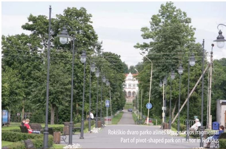
Rokiškio dvaro parko ašinės kompozicijos fragmentai Part of pivot-shaped park on manor in Rokiškis