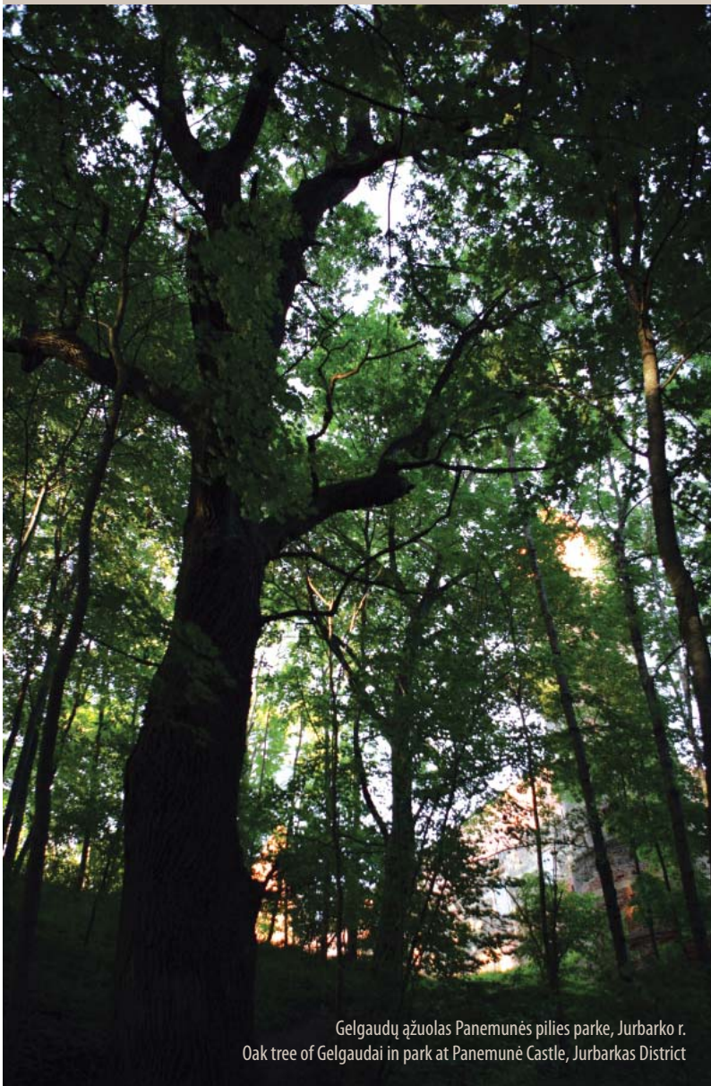
Gelgaudų ažuolas Panemunės pilies parke, Jurbarko r. Oak tree of Gelgaudai in park at Panemunė Castle, Jurbarkas District

Teksto autorius Dr. Kęstutis Pranas Labanuskas