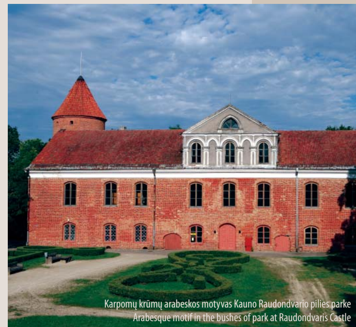
Karpomų krūmų arabeskos motyvas Kauno Raudondvario pilies parke Arabesque motif in the bushes of park at Raudondvaris Castle