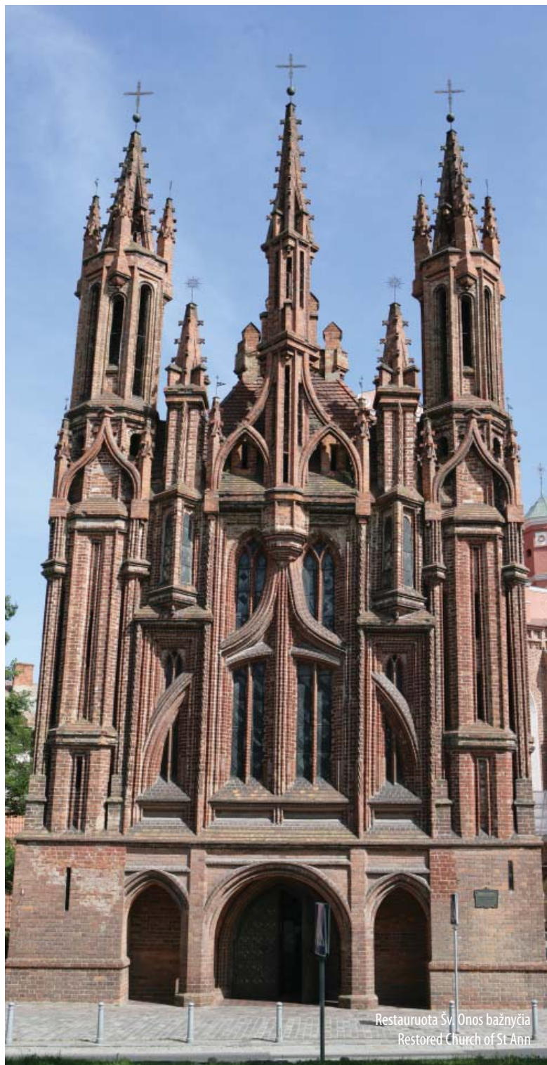
Restauruota Šv. Onos bažnyčia Restored Church of St. Anne

However, a very important law for the protection of cultural monuments, which was drafted in 1926, 1933, 1938 and 1939, was only signed on 20 July 1940, when Soviet armed forces were already in the country. Under the new law, an Office of Cultural Monuments Protection staffed with 12 people started operating within the Ministry of Education. It was headed by Adolfas Nezabitauskis from 1941 until 1944.