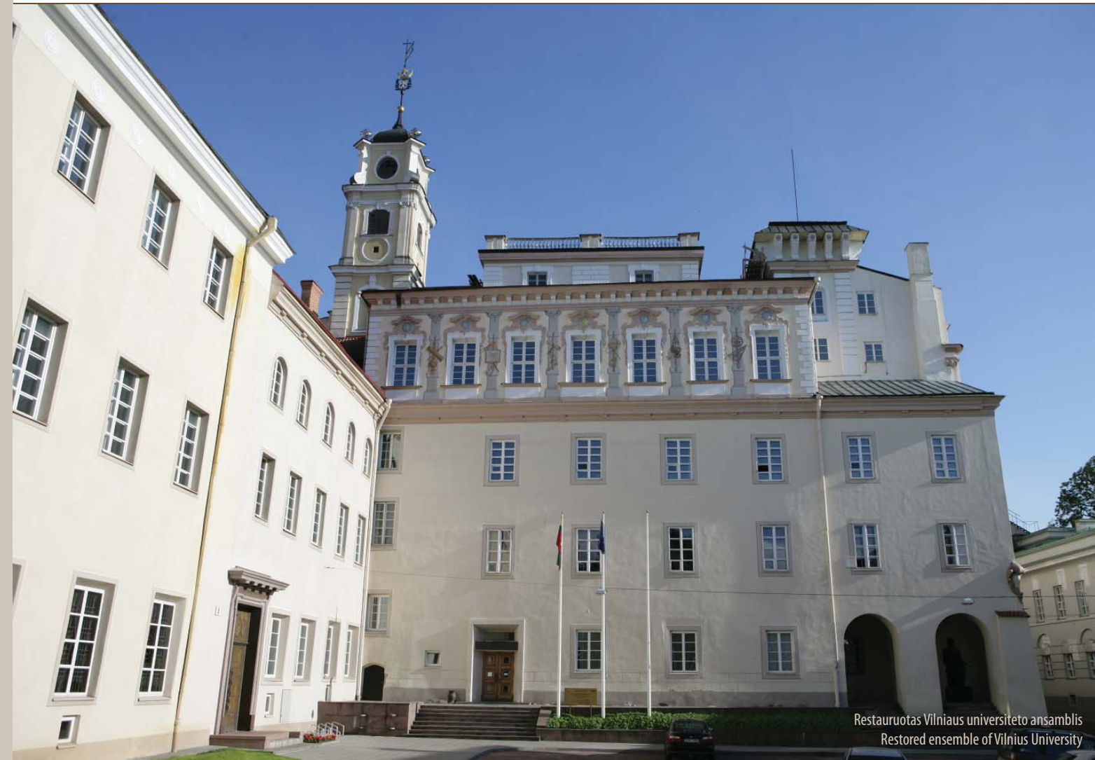
Restauruotas Vilniaus universiteto ansamblis Restored ensemble of Vilnius University

Teksto autorius Dr. Jonas Glemža